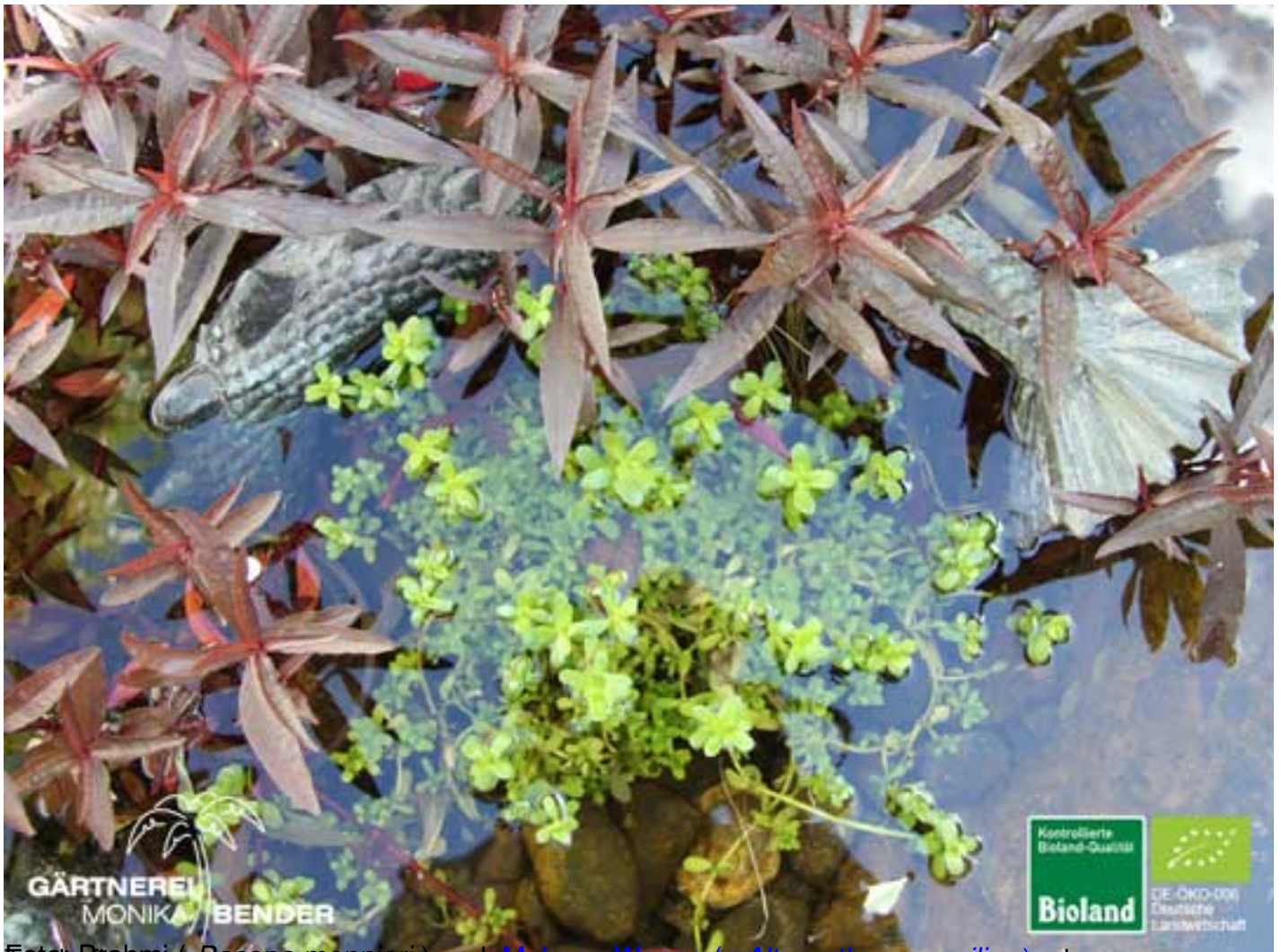
Fettblanze ( Bacopa monnieri ) und Mukuru-Wenna ( Alternanthera sessilis ) als